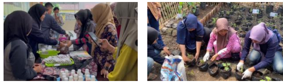
Gambar 3. Pembuatan Produk dan Penanaman TOGA bersama

Setelah tumbuhnya minat masyarakat terhadap bunga rosella dan daun stevia, telah dibentuk kelompok SANTARA (Sahabat Antioksidan Nusantara) yang bertanggung jawab atas keberlangsungan Taman Antioksidan serta PUDORA dan ROSTEA. Dengan adanya kelompok SANTARA ini, program SINC ( Sugar In Control ) dapat berkelanjutan dan memiliki dampak yang besar dalam pemeliharaan kesehatan pada masyarakat Desa Biting, Kabupaten Jember, Provinsi Jawa Timur. Seperti dijelaskan oleh Mukti et al., 2024, keberhasilan program pengabdian berbasis tanaman herbal tidak hanya diukur dari peningkatan pengetahuan, tetapi juga dari dampak sosial dan ekonomi yang dihasilkan bagi masyarakat.