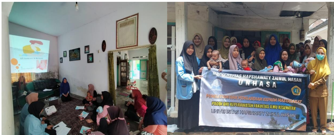
Gambar 3: Dokumentasi Pelaksanaan Kegiatan Edukasi Supportif Tentang Pemberian ASI Eksklusif